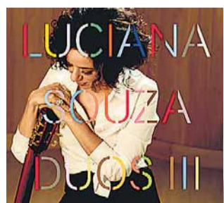
Duos III. Sequência natural